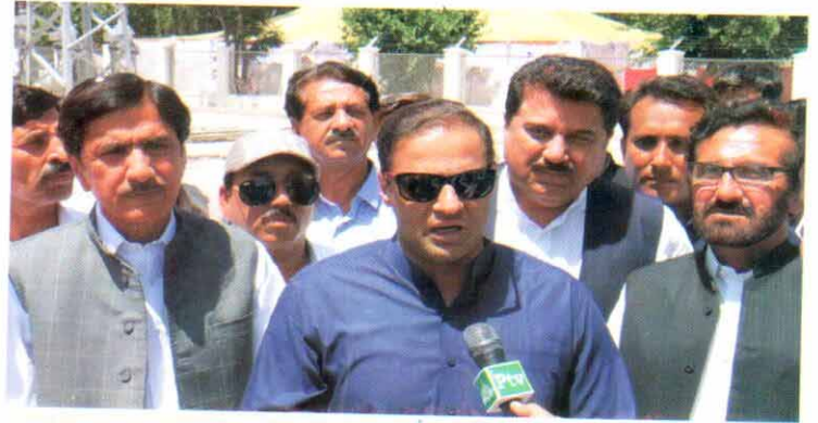
وزیر مملکت برائے پانی و بجلی عابد شیر علی فتح پور گروڈ اسٹیشن کے افتتاح کے موقع پر میڈیا سے گفتگو کر رہے ہیں