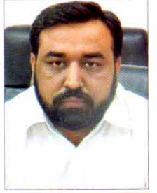
تحریر: ساجد یعقوب کمبانی سیکرٹری میپکو

حسد و کینہ ایسی بری عادت ہے جس کی مذمت کے بارے میں بہت سی احادیث بیان ہوئی ہیں۔ یہ تو ظاہر ہے کہ حسدِ نعمت پر ہی ہوا کرتا ہے۔ پس جب اللہ تبارک و تعالیٰ کسی بندہ کو نعمت عطاء فرمائے تو دوسرے شخص کو اُس کے پاس وہ نعمت بری معلوم ہو اس کو حسد کہیں گے۔ حضرت سیدنا آدمؑ کی تخلیق کے بعد سب سے پہلے حسد کرنے والا ابلیس ہے اور یہ حاسدین کا قائد ہے۔ حضرت آدمؑ کی اولاد میں حسد کی آگ میں جلنے والا قابیل ہے جس نے اپنے بھائی ہابیل کو قتل کر دیا۔