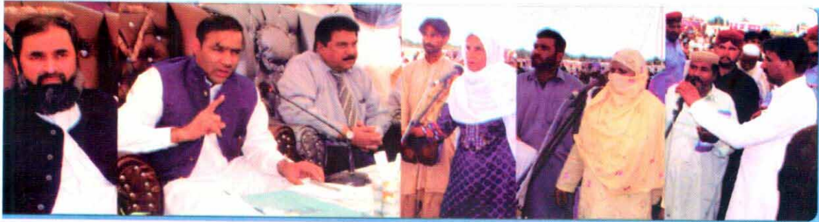
وزیر مملکت برائے پانی و بجلی عابد شیر علی بہاولپور میں منعقدہ کھلی کچہری کے موقع پر صارفین کی شکایتیں سن رہے ہیں

وزیر مملکت برائے پانی و بجلی عابد شیر علی نے کہا ہے کہ کھلی کچہریوں کے ذریعے عوام کی دہلیز پر جا کر مسائل حل کر رہے ہیں۔ عوامی شکایتوں پر اب تک پورے ملک میں 160 ملازمین کے خلاف کارروائی کر کے سزائیں دی ہیں۔ عوام کے مفاد کو نقصان پہنچانے