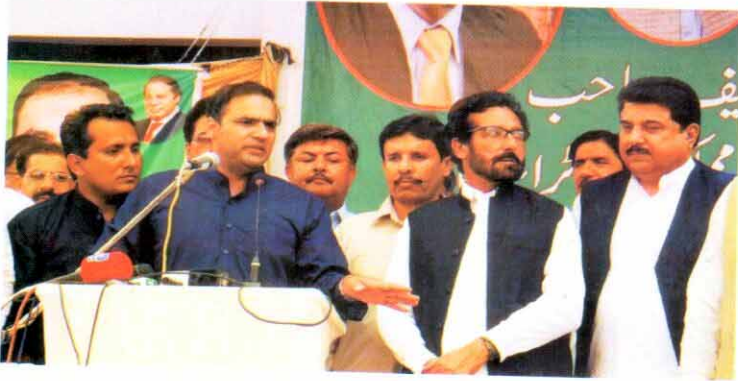
وزیر مملکت برائے پانی و بجلی عابد شیر علی فتح پور گروڈ اسٹیشن کے افتتاح کے موقع پر جلسہ سے خطاب کر رہے ہیں