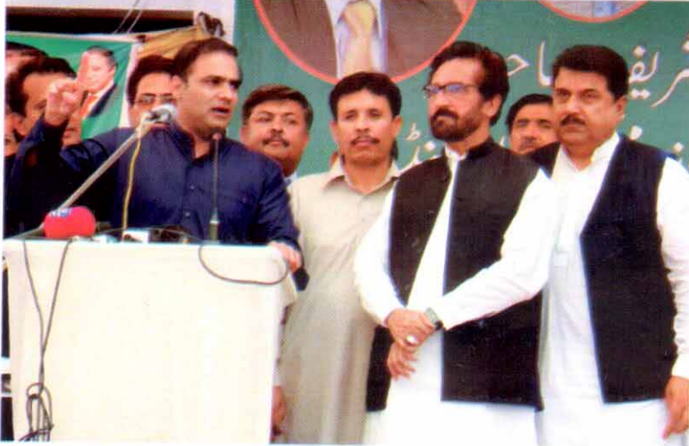
وزیر مملکت برائے پانی و بجلی عابد شیر علی فتح پور گرڈ اسٹیشن کی افتتاحی تقریب سے خطاب کر رہے ہیں

بجلی بحران کے خاتمہ سے ملک معاشی طور پر ترقی کرے گا۔ سابق صوبائی وزیر زراعت ملک احمد علی اولکھ