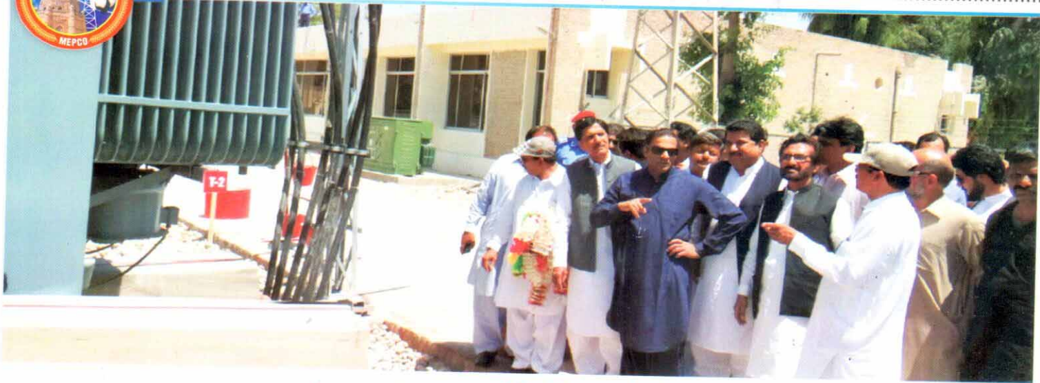
وزیر مملکت برائے پانی و بجلی عابد شیر علی گروڈ اسٹیشن کے افتتاح کے بعد معائنہ کر رہے ہیں